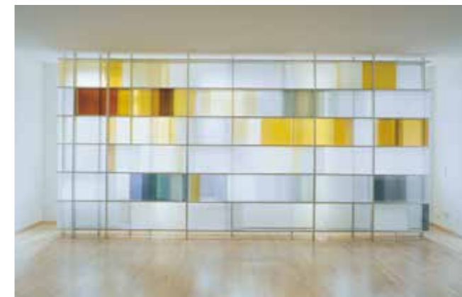
unten: Tübingen, Universitätsfrauenklinik, Kapelle Aluminium/Glas/keramische Farben/Sandstrahlmattierung 300 x 600 cm, 2002 rechts oben: „chromatic scale 29“ Sparkassen Carré Tübingen, 2006 Deckeninstallation im Forum, Edelstahl/Silikon/Schmelzfarben/Glas/ Sandstrahlmattierung