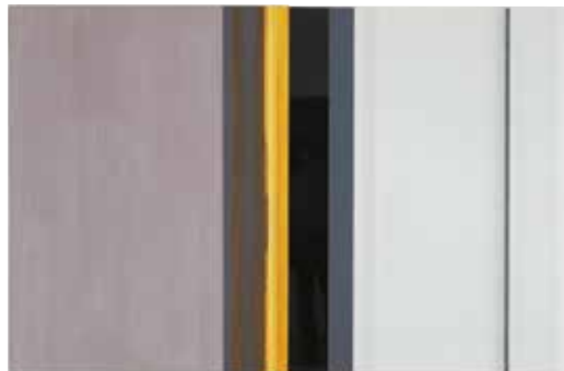
„Offenes System II“ 1999 138 x 210 cm 2-tlg., Acryl auf Leinwand | Keramische Farben/Glas

Die 2006 entstandene Serie mit graphischen Strukturen visualisiert die werkimmanente Raumbezogenheit von Hubers Kunst. Die aufgetragenen linearen Strukturen machen die Grenzen des physikalischen Trägers sichtbar, gleichzeitig spiegelt das Glas den umgebenden Raum oder lenkt den Blick des Betrachters – im Falle einer durchsichtigen Fläche – durch die Trägerebene hindurch in den Hintergrund. Die Schichtung verschiedener Wahrnehmungsebenen im Kunstwerk reflektiert gleichsam unterschiedliche zeitliche Prozesse. Das Ausschnitthafte der dargestellten Strukturen ist gedanklich fortsetzbar und wirkt in den sie umgebenden Raum hinein.