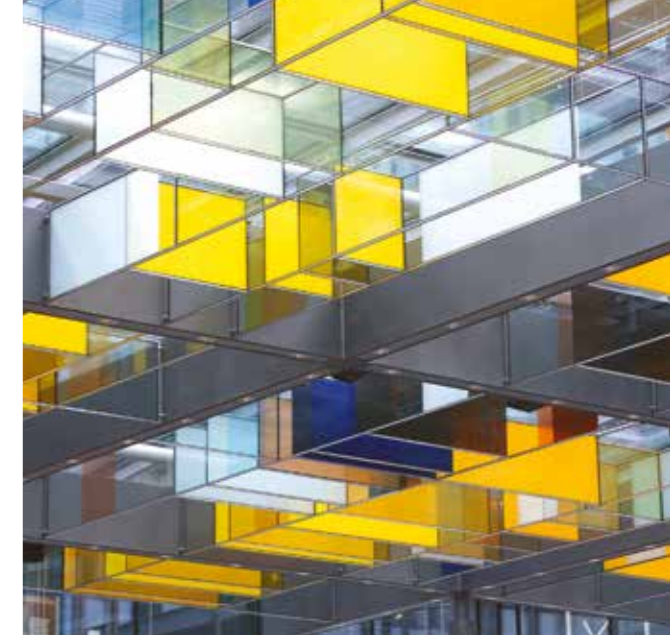
„chromatic scale 29“

chromatic scale bezeichnet die strukturelle Ebene und das Farbkonzept der Leiteranordnungen des integrierten Kunstwerks im Foyer der Sparkassenzentrale in Tübingen. Das Verwaltungsgebäude ist im ursprünglichsten Sinne ein Ort der Zahlen. Gleichmaßen spielt die Zeit eine bedeutende Rolle, ist sie hier schließlich Multiplikator jeglicher Berechnung. Verdichtungen und Parallelität mehrerer Abläufe im Sinne einer Gleichzeitigkeit ist auch bei meinen Progressionen ein Faktor - es ist so wie wenn eine eingefrorene Momentaufnahme diese Situation dieses zeitlichen Ablaufs widerspiegelt. Wie bei einer Melodie gibt es mehrschichtige Überlagerungen im Duktus der verschiedenen räumlichen Glasträgeranordnungen. Die farbliche Ebene der transparenten und opaken Flächen überspielt die Strenge des orthogonalen Gitters und erzeugt ein vibrierendes Spiel von Reflexen und Erscheinungen. Die Wirkung verändert sich ständig mit dem Lichteinfall der wechselnden Tageszeiten. Jede Bewegung und Standortveränderung des Betrachters bringt eine neue Situation hervor. Im Sinne einer überdimensionalen Rechenmaschine erinnern die zeitlichen Abläufe durch ihre strukturelle Form an diese unzählig stattfindenden Rechengänge. Es ist eine Widmung an die im Hause arbeitenden Menschen und eine Veranschaulichung und Reflektion dessen, was an diesem Ort geschieht.