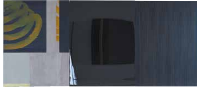
oben: „Dreiteilig mit Raumumgebung“ 1999 138 x 315 cm 3-tlg., Acryl auf Leinwand | Keramische Farbe/Glas, Privatbesitz unten: „saad“ 2006, 203 x 147 cm, Edelstahl/Silikon/Glas/Keramische Farbe unten rechts: „lineares Objekt 2“ 2006, 203 x 147 cm, Stahl/Blei/Antikglas