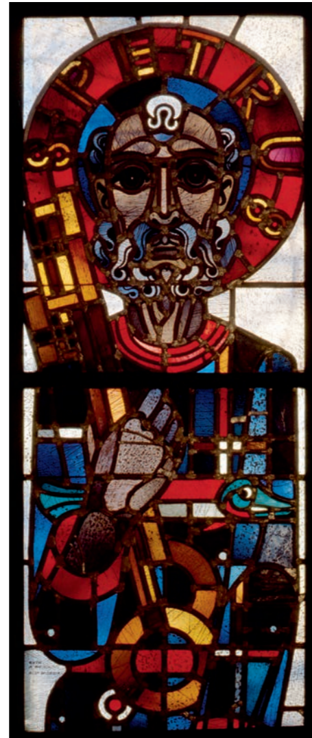
Petrus, 1937 , Chorfenster, Krypta der Kathedrale in Luxemburg Glasmalereiwerkstatt Wilhelm Derix, Düsseldorf

Nachdem sich Anton Wendling zunächst dem Holzschnitt und der Buchkunst verschrieben hatte, markieren die Fenster in der spätgotischen Klosterkirche Marienthal bei Wesel 1926/27 seinen Durchbruch als Glasmaler. In der Folgezeit begründen vor allem seine Figurenfenster seinen Ruf als außergewöhnlichen Glaskünstler. Sie zeichnen sich durch