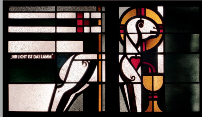
Lamm Gottes, 1954, Klosterkirche Marienthal/Wesel Glasmalereiwerkstatt Hein Derix, Kevelaer